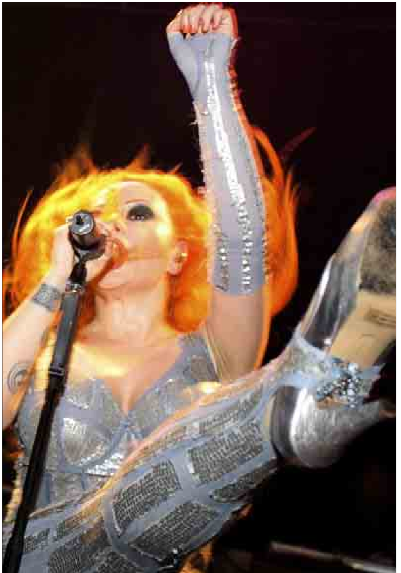
Alaska, el jueves por la noche en la sala Cool en el cuarto concierto consecutivo de su «tour» madrileño.

El Hospital del Tajo, inaugurado ayer por Aguirre en Aranjuez, estará a pleno rendimiento a principios del próximo año /2