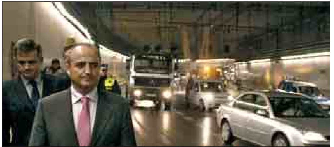
El pasado jueves el candidato socialista a la Alcaldía llegó a pie hasta el lugar de la fuga de agua, en el interior del túnel.

obligación de hacer sólo puede responder a su desgana o a su desinterés por seguir trabajando para los madrileños». Tildó de «mezquino» que Calvo califique de «simple accidente» la inundación.