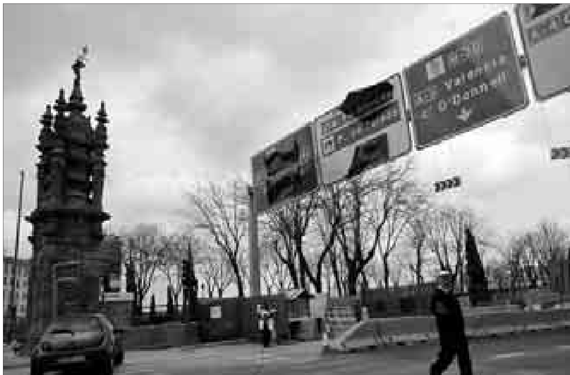
MARQUÉS DE VADILLO

El nuevo bulevar de la Avenida de Portugal, inaugurado el pasado viernes, ha sido uno de los principales cambios en superficie como consecuencia de la reforma de la M-30. La construcción de dos túneles para comunicar con la A-5 ha permitido que ahora haya un bulevar peatonal pegado a la Casa de Campo.