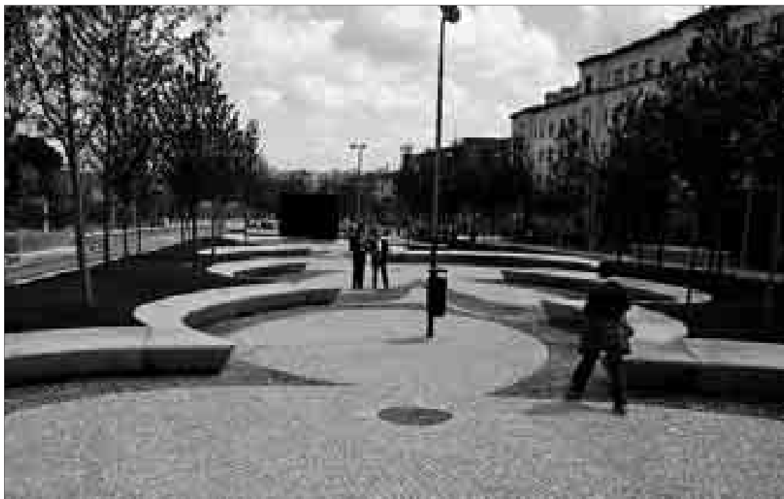
AVENIDA DE PORTUGAL

El túnel de Sor Ángela de la Cruz no estaba incluido en el primer proyecto de reforma de la M-30. Al final se ha construido un túnel que pasa bajo Bravo Murillo y llega a la avenida de los Pinos. Arriba, el tráfico se ha vuelto algo más lento porque los conductores que van a Bravo Murillo o Marqués de Viana se encuentran con menos espacio para maniobrar, y con unos cuantos semáforos en estas calles que antes no estaban.