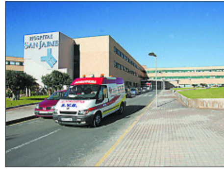
Hospital San Jaime de Torrevieja (Alicante).