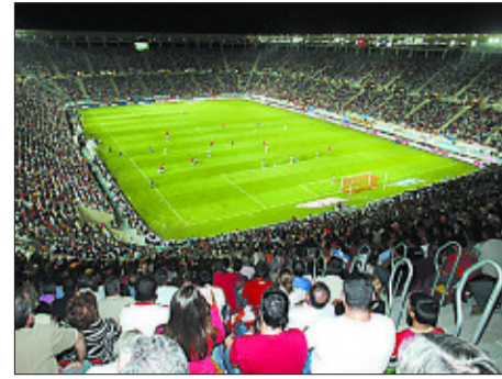
Estadio Nueva Condomina, en Murcia.

Viene de la página 29 de la Torre (PP), espera inaugurar antes de mayo el proyecto más señero que ha afrontado en su segundo mandato: la rehabilitación del Paseo del Parque, eje principal para el tráfico en el que el consistorio invierte 9,7 millones de euros.