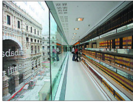
Nueva biblioteca foral en Bilbao.