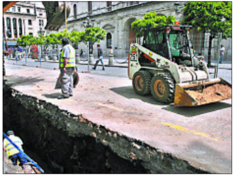
Obras para construir el Metrocentro (Sevilla).