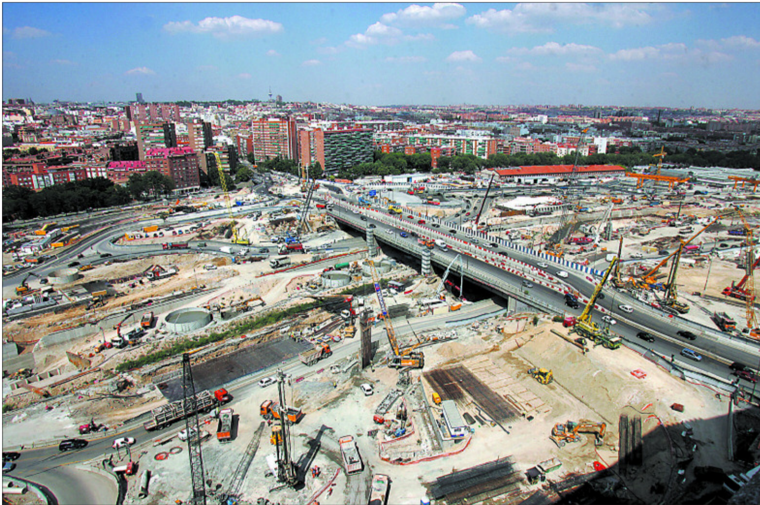
Vista panorámica de las obras de soterramiento de la M-30 a la altura del puente de Praga, en Madrid.

Ayuntamiento. La alcaldesa, Rita Barberá (PP), ha marcado en rojo el mes de marzo para inaugurar el Bioparc, un gran zoológico para 4.000 animales que recrea ambientes de varios continentes. La inversión (21,4 millones) no sale directamente de las arcas municipales, pues lo construye una empresa que explotará el recinto durante 50 años. Antes de las elecciones, Barberá compartirá honores con el presidente valenciano, Francisco Camps (PP), en la apertura de un “hito arquitectónico”: una plaza porticada del arquitecto Santiago Calatrava en la Ciudad de las