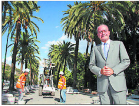
El alcalde de Málaga, en el paseo del Parque.