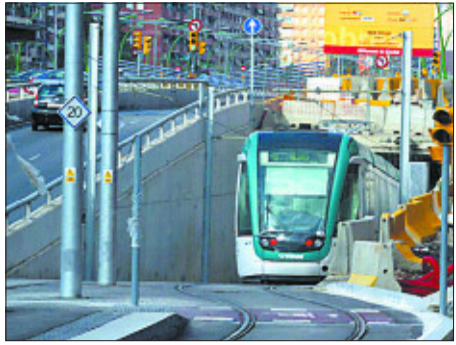
Tranvía del Besòs (Barcelona) en viaje de prueba.