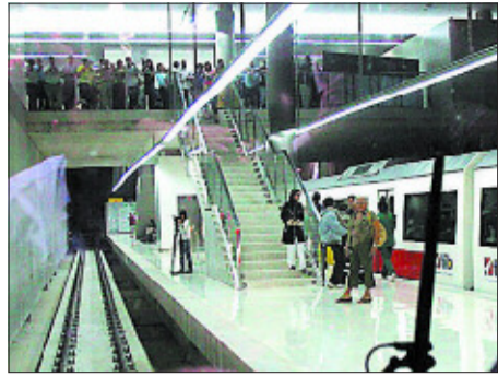
Estación subterránea de tren en Palma.