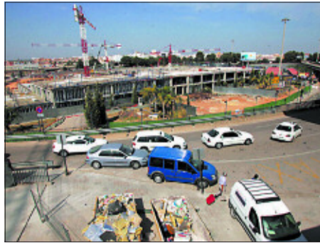
Ampliación del aeropuerto de Manises (Valencia).