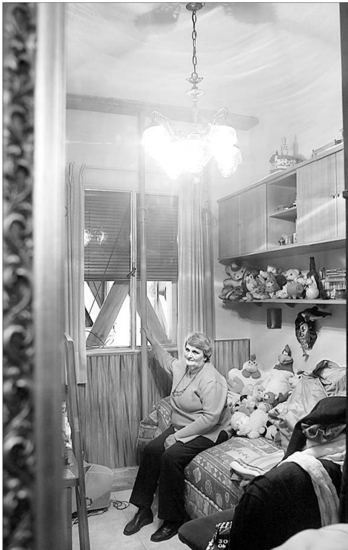
Charo Miguel, en una habitación de su casa, apuntalada a causa de las grietas.