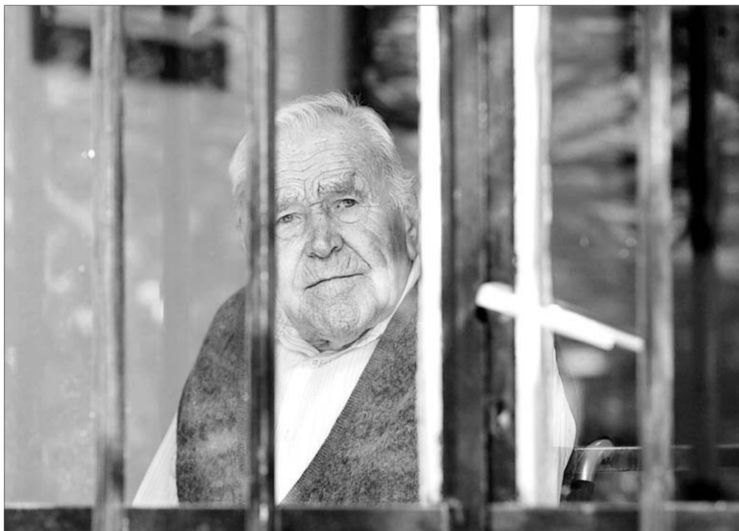
Uno de los ancianos que viven en la residencia Margarete.